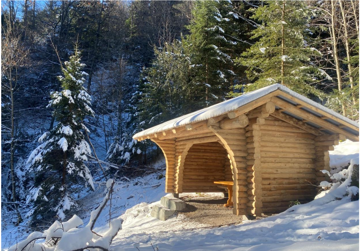
Sanierung Lüchiger-Hütte an der alten Kapfgasse